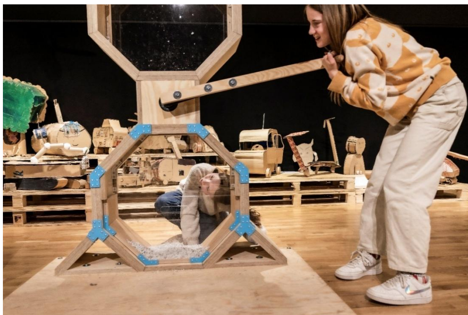
Möjlighetsmaskiner, pedagogiskt projekt 2023/2023. Finansierat av Postkodstiftelsen. (Karl Melander)

Sedan konstmuseibyggnaden stängde i slutet av 2019 har konstmuseiverksamheten bedrivits i lika hög grad som tidigare genom utställningar på Fornsalen samt på andra platser runtom på Gotland, i samverkan med olika aktörer och samverkanspartners. Flera större pedagogiska projekt har möjliggjorts med medel från bl a Arvsfonden och Postkodstiftelsen.