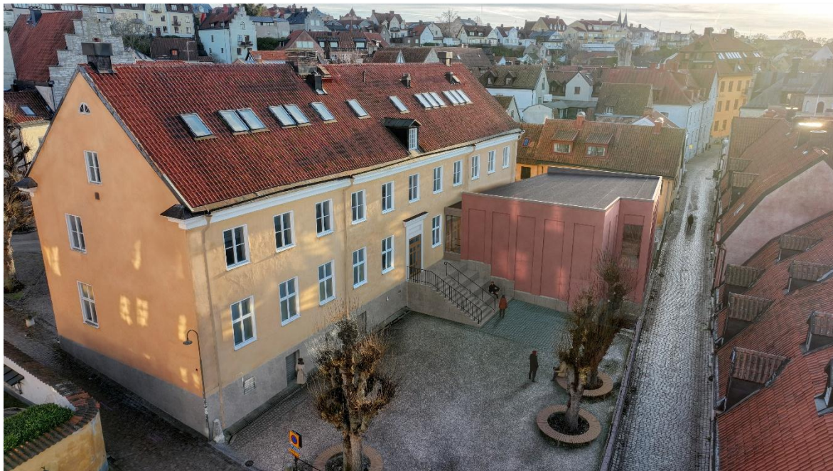
Visionsbild av tillbyggnaden, framtagen under projekteringen (SWECO)

Parallellt med projekteringen av om- och tillbyggnaden tas bygglovshandlingar, systemhandlingar och förfrågningsunderlag för en samverkansentreprenad fram. Dessa handlingar beräknas finnas klara under våren 2025.