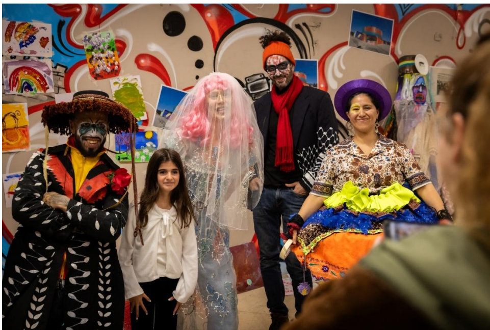
Bingan gemenskapar, hösten 2024. (Karl Melander)

När verksamheten tidigare bedrevs i konstmuseihuset var öppettiderna tisdag till söndag, kl 12-16, samt något utökat på sommaren. Museets besöktes årligen av ca 12 000 besökare. I den satsning vi önskar göra framåt, med kvalitativa utställningar, pedagogiska projekt och med den samverkan vi hoppas uppnå med Resurscentrum för konst och form samt BAC är målet att nå ca 40 000 besökare och att byggnaden ska bli den självklara noden för konst- och formområdet på Gotland. Om detta ska uppnås krävs utökade öppettider samt ökade resurser för pedagogik och bemanning i huset. Denna satsning ger också ökade intäkter i form av entréer, konferensverksamhet och lokalhyror.